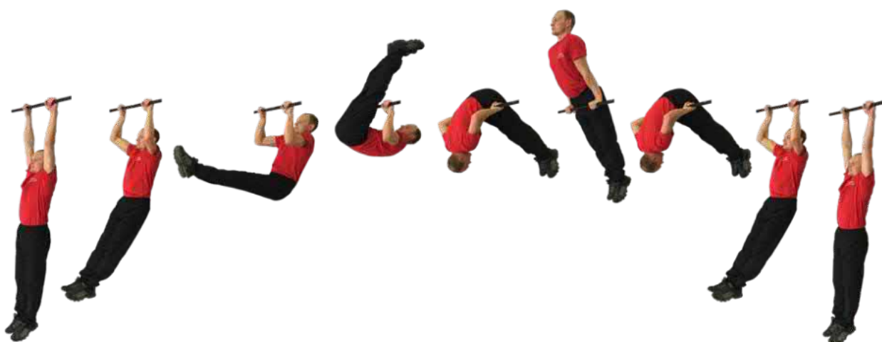
Рис. 2. Подъем переворотом на перекладине