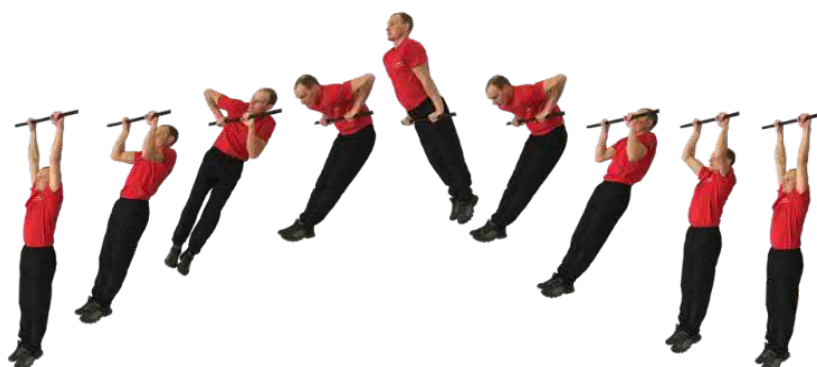
Рис. 3. Подъем силой на перекладине