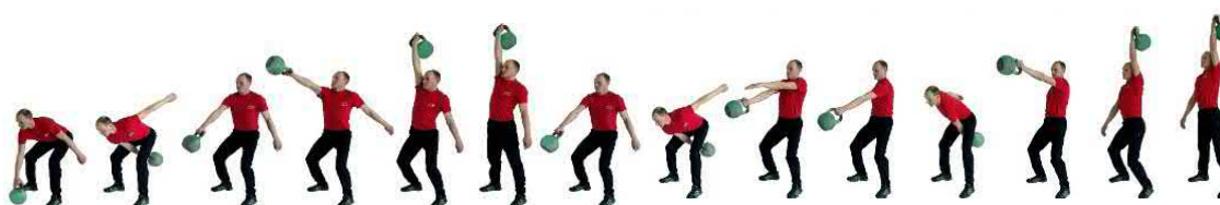
Рис. 4. Рывок гири

При нарушении условий выполнения упражнения повторение не засчитывается, подается команда «НЕ СЧИТАТЬ».