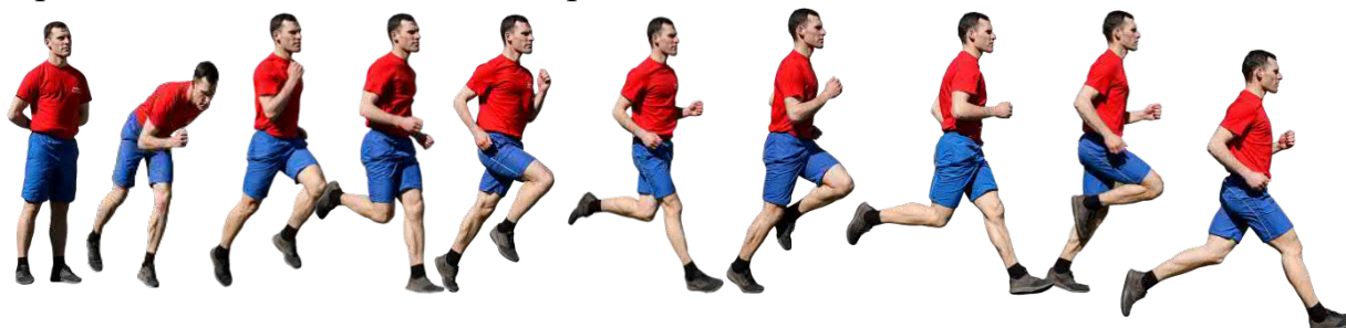
Рис. 7. Бег на 1 км, бег на 3 км.

Старт и финиш, как правило, оборудуются в одном месте. При выполнении упражнений на беговой дорожке стадиона старт и финиш производится в соответствии с разметкой стадиона.