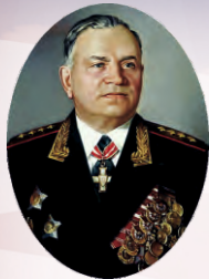
Генерал армии А.В. Хрулёв

Военная орденов Кутузова и Ленина академия материально-технического обеспечения имени генерала армии А.В. Хрулёва Министерства обороны Российской Федерации прошла большой и славный путь своего становления и развития. Она ведет свою историю с 31 марта 1900 года, когда в столице России – Петербурге впервые в мире было создано специальное военно-учебное заведение тыла – Интендантский Курс для подготовки офицеров и чиновников интендантского ведомства.