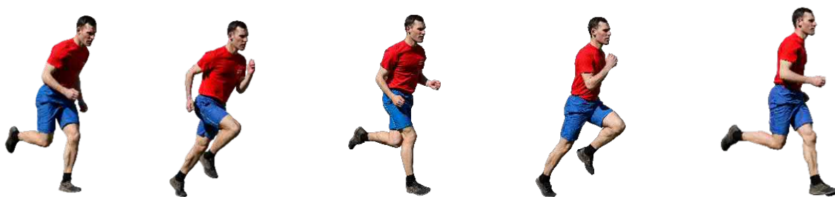
Рис. 5. Бег на 60 м, бег на 100 м