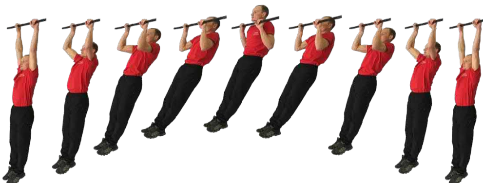
Рис. 1. Подтягивание на перекладине

При нарушении условий выполнения упражнения, повторение не засчитывается, подается команда «НЕ СЧИТАТЬ».