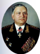
Генерал армии А.В. Хрулёв

Военная орденов Кутузова и Ленина академия материально-технического обеспечения имени генерала армии А.В. Хрулёва Министерства обороны Российской Федерации прошла большой и славный путь своего становления и развития. Она ведет свою историю с 31 марта 1900 года, когда в столице России – Петербурге впервые в мире было создано специальное военно-учебное заведение тыла – Интендантский Курс для подготовки офицеров и чиновников интендантского ведомства.